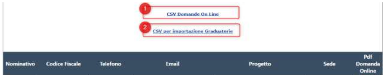
Figura 7 Download file CSV in caso di bando terminato