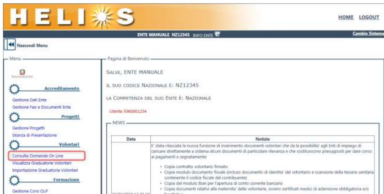
Figura 1 Menu di accesso alla funzione "Consulta Domande On Line"

Per agevolare la consultazione delle domande è stata implementata una specifica funzionalità accessibile dal menu "Volontari" -> "Consulta Domande On Line" (vedi figura 1)