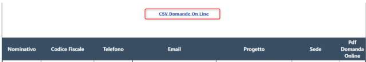
Figura 6 Download file CSV in caso di bando in corso

In caso di bando volontari aperto la funzione produce un solo file contenente tutti i dati delle domande presentate dai volontari.