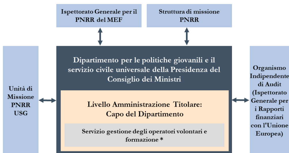
Figura 3 - Governance multilivello

La gestione del PNRR prevede l'adozione di un modello di governance multilivello come di seguito rappresentata nella figura 3.