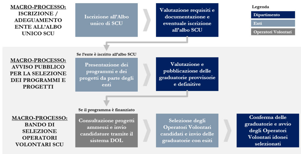
Figura 4 - Procedure di selezione nel ciclo di vita del Servizio Civile Universale

Le fasi principali attinenti a tali procedure di selezione sono illustrate nel diagramma che segue, mentre una più estesa descrizione degli stessi è riportata nei paragrafi successivi.