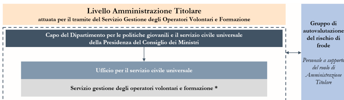
Figura 1 – Organigramma della struttura organizzativa dell'Unità di Missione di livello dirigenziale generale per l'attuazione degli interventi del PNRR – Amministrazione Titolare

* Si segnala che solo una parte dei funzionari del Servizio svolgono attività in relazione alla funzione di Amministrazione titolare